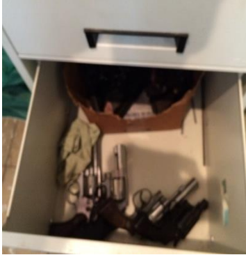
Armas custodiadas en un archivo