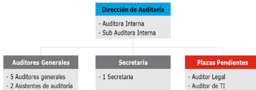
Figura 3. Organigrama de la AI

Actualmente, la Auditoría Interna del MJP cuenta con 10 funcionarios en total. La estructura organizativa se detalla en la siguiente figura.